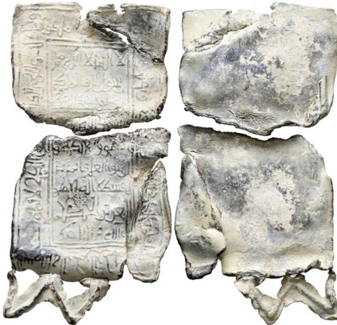
Lote 1020. PERIODO ALMORÁVIDE O POSTERIOR. Amuleto rectangular. (Pb. 16,40g/68x33mm). Posiblemente Siglo

La morfología y las inscripciones varían según su uso, al igual que los símbolos que los decoraban. Generalmente cubren toda la superficie en honor al característico “horror vacui” de la estética musulmana. En cuanto al material utilizado son fundamentalmente de plomo, aunque también los hay de bronce, e incluso hueso y oro.