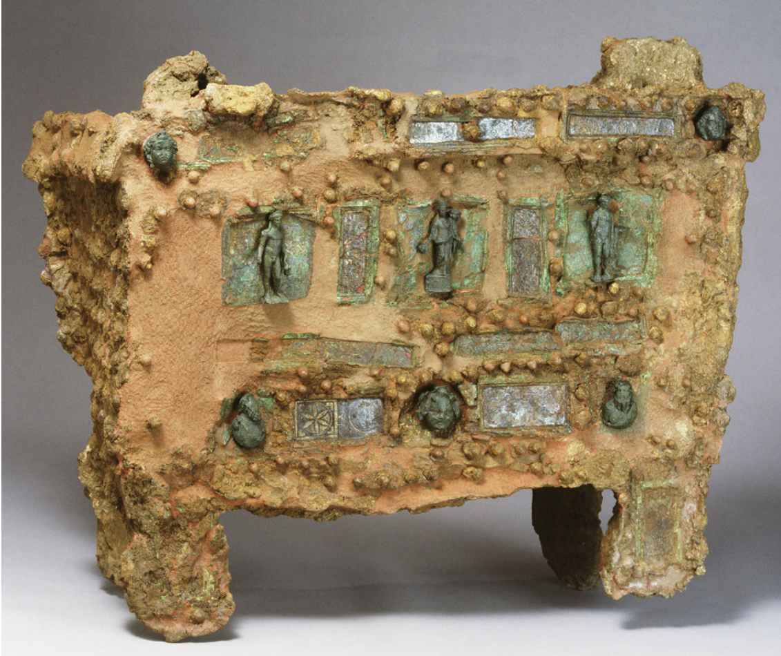
Arca de Turiaso.

Nos detenemos en ésta última dado su magnífico estado de conservación y las peculiaridades de su hallazgo.