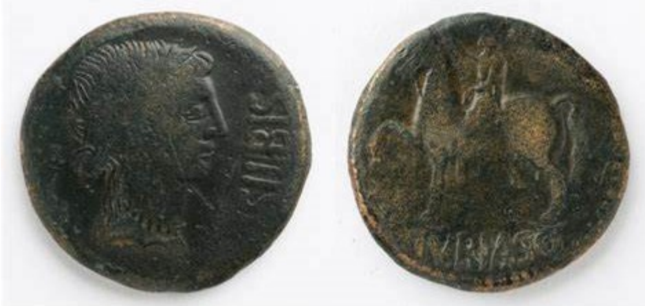
As de Turiaso (Museo de Zaragoza)

La llamada arca ferrata de Turiaso, que se conserva en el Museo de Zaragoza, es un caso excepcional por su conservación, sólo comparable con las halladas en el área vesubiana.