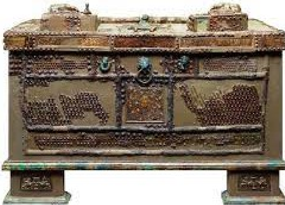
Arca de Oplontis.

además de 20 monedas de bronce. Sin embargo ese no era su contenido total.