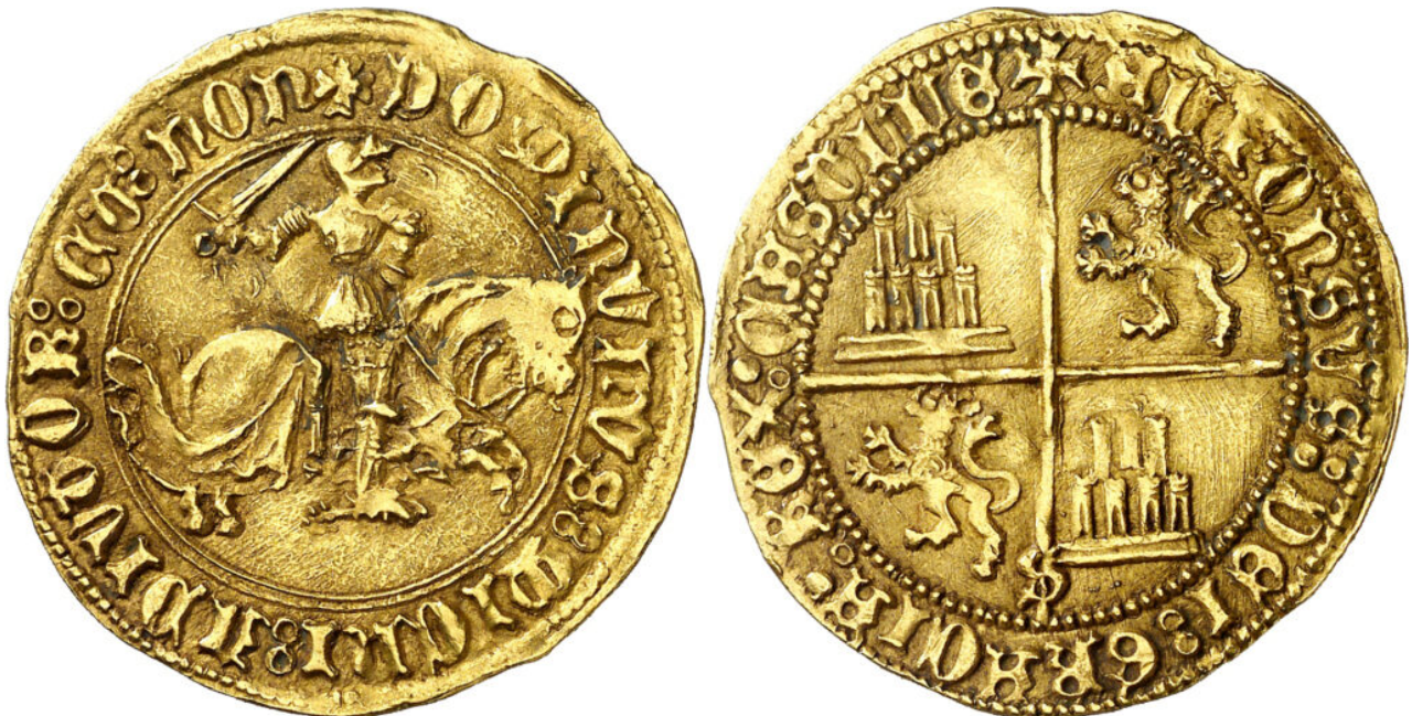
Subasta 412 - Lote 254

Entre las acuñaciones de oro hay ocho espectaculares doblas ecuestres, a cada cual más bella. Poca cosa podemos añadir sobre las doblas ecuestres de Alfonso de Ávila, con su poderosa imagen de caballería, una de las más icónicas de la Edad Media. De entre ellas destaca por su calidad una dobla acuñada en Sevilla, de técnica impecable y estilo absolutamente gótico. Si nos viéramos obligados a elegir una imagen representativa caballeresca sin duda podríamos elegir la de este espectacular anverso.