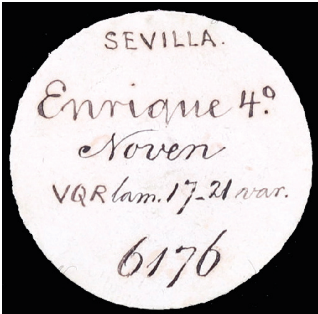
Tejuelo original de la Colección Vidal Quadras

La profusión de cecas y tipos de Enrique IV está totalmente representada y en buenas calidades. De Sevilla, una ceca que destaca por la calidad artística de sus acuñaciones, encontramos unos preciosos reales de busto y de anagrama.