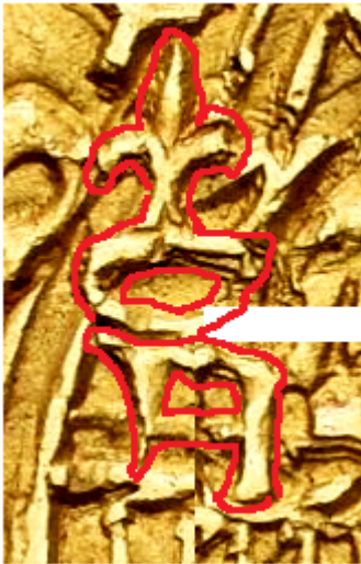
Letra A coronada.

derecha de la A y alineando el travesaño central la letra queda perfectamente identificada.