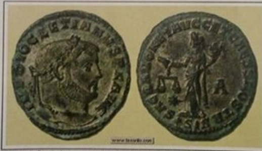
Moneda de Diocleciano con reverso de moneta

FORTUNAE REDVCI AVGG . NN con el motivo de Fortuna sentada FORTUNAE REDVCI CAESS . NN con el motivo de Fortuna de pie GENIO POPULI ROMANI Motivo de genio erguido SACRA MONET AVGG ET CAESS NOSTR. Moneta estante con balanza y cornucopia