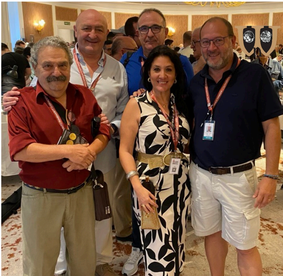
Miembros y fundadores de denarios.org en el Evento Numismático Internacional Madrid 2024