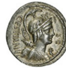
VACUNA Serie: Dioses república Crawford 409/1 Ver Ficha >

Dada la importancia de las imágenes en esta web, se citan todas las casas de subastas que han dado su autorización expresa para la publicación de sus fotografías.