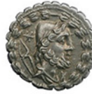
VULCANO Serie: Dioses república Crawford 314/1b Ver Ficha >