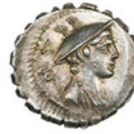
MERCURIO Serie: Dioses república Crawford 362/1 Ver Ficha >