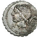
SATURNO Serie: Dioses república Crawford 313/1b Ver Ficha >

TODOS (40) NOVEDAD (6) DIOSES REPÚBLICA (15) IMPERATORIALES (7) IMPERIO (18)