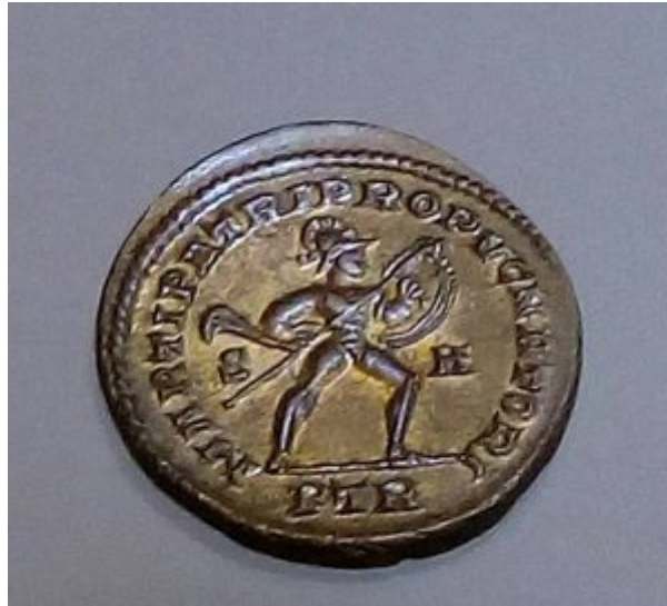
MARTI PATRI PROPVGNATORI

En cuanto al estado de conservación del conjunto monetar, no mencionado en el informe, las monedas expuestas están en EBC e incluso SC.