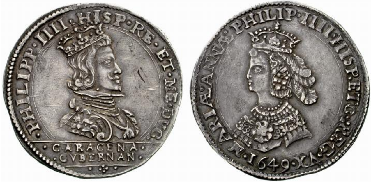
Moneda especial. Medio filippo. 1649.