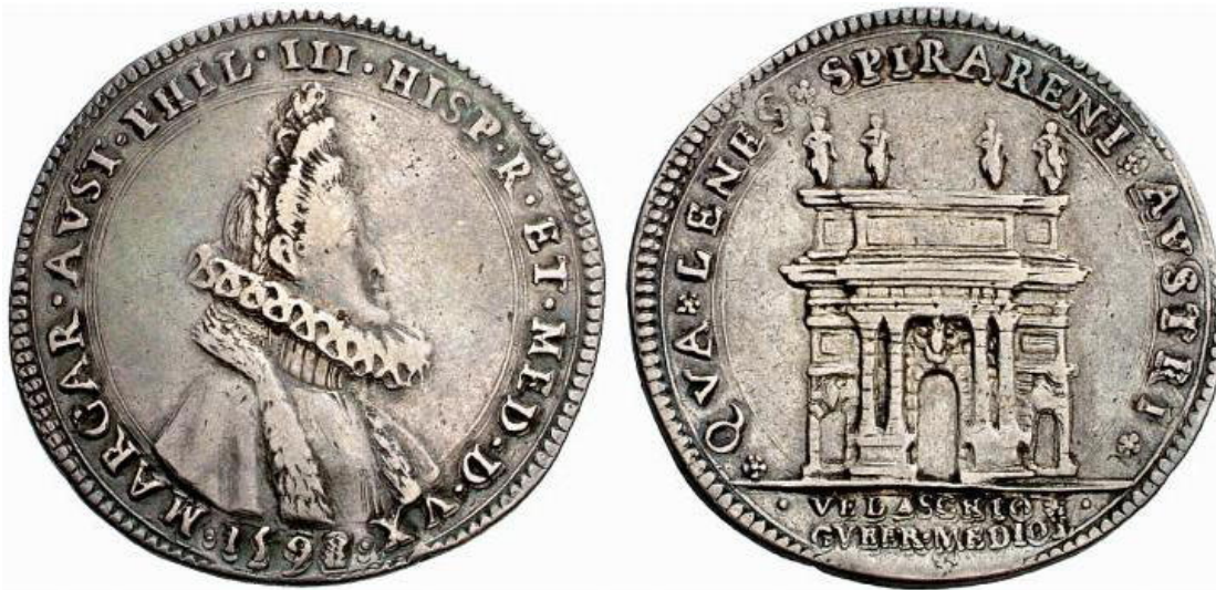
Moneda especial. 50 sueldos. 1598.

Precisamente el arco de Porta Romana es el motivo que aparece en el reverso de una magnífica acuñación de la ceca de Milán, emitida con claros fines ostentosos. Se trata de una tipología de gran rareza, de la que se conocen siete ejemplares en plata y un único ejemplar en oro. Este tipo de moneda no solo es interesante por su particular reverso sino también por su magnífico anverso, en el que aparece grabada la efigie de la reina Margarita vestida con un manto bordeado de piel y con el cabello recogido en un elaborado peinado. Se trata de una auténtica celebración de la figura soberana, representada con vestimentas absolutamente a la moda y de gran impacto visual: una majestuosa demostración de poder comunicada visualmente.