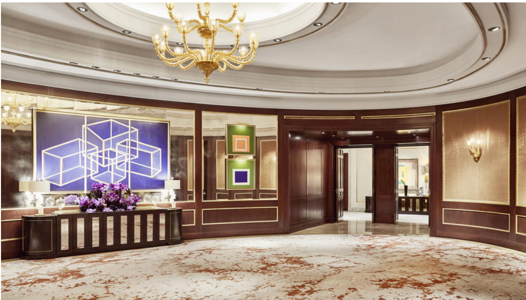
Imagen de uno de los salones donde se celebrará la convención.

Un aspecto muy importante sobre el desarrollo de la convención y sobre el que han puesto especial hincapié los organizadores, ha sido la seguridad. Para ello, el principal método de control ha sido la distribución de entradas numeradas, limitadas y personalizadas que se repartirán en los espacios habilitados para ello. De esta manera el aforo estará controlado para la tranquilidad de coleccionistas y comerciantes. El límite de entradas ha supuesto la primera gran novedad a la que nos hemos tenido que enfrentar los numismáticos españoles ya que no estábamos acostumbrados a este tipo de control de acceso.