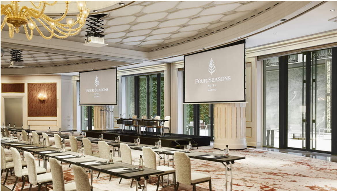
Salón de conferencias.