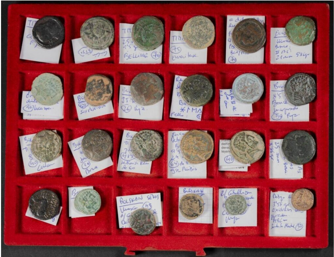
HISPANIA ANTIGUA. Lote de resto de colección formado por alrededor de 160 monedas, fundamentalmente bronzes, con un gran variedad de módulos, tipos y cecas. Diferentes estados de conservación, permite ser un magnífico punto de partida para iniciar una colección. Se remató en 5.000€ el 24/10/2024