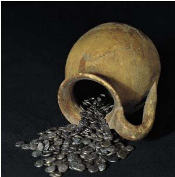
Tesoro de la neápolis.

En Barcelona , encontraremos otra de las salas de numismática de visita obligatoria al menos una vez, la del Gabinet Numismàtic de Catalunya ( web y horarios ) . La encontrareis integrada en el espectacular Museu Nacional d'Art de Catalunya, en el Palau de Montjuic, desde el que además tendréis una de las mejores vistas de la ciudad. En la sala numismática podréis realizar un recorrido histórico a través de la moneda catalana, así como deteneros a contemplar algunos tesoros muy importantes, como el impresionante de