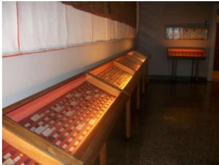
Museo Correr, Venecia.