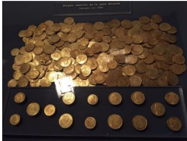
Uno de los tesoros -en este caso onzas- expuestos en Burgos.

Como os comenté al principio, prácticamente en cualquier museo arqueológico encontrareis monedas expuestas, y en algunos incluso agradables sorpresas, como en el de Burgos, al que fueron unos amigos el invierno pasado y se encontraron con varios tesoros impresionantes, o el de Soria, con interesantes conjuntos de denarios ibéricos.