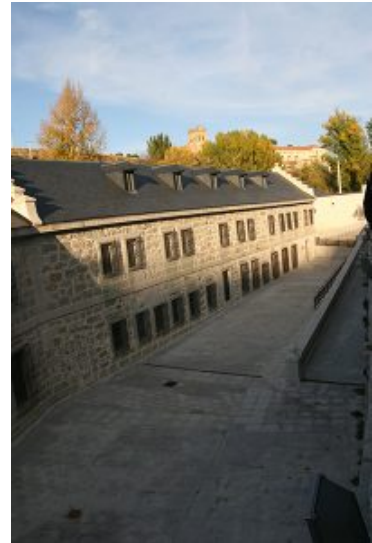
Y el mismo patio, en el año 2011