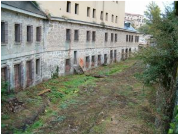
Aspecto que presentaba el patio cuando lo visitamos durante el Congreso Nacional de Numismática, 2004.