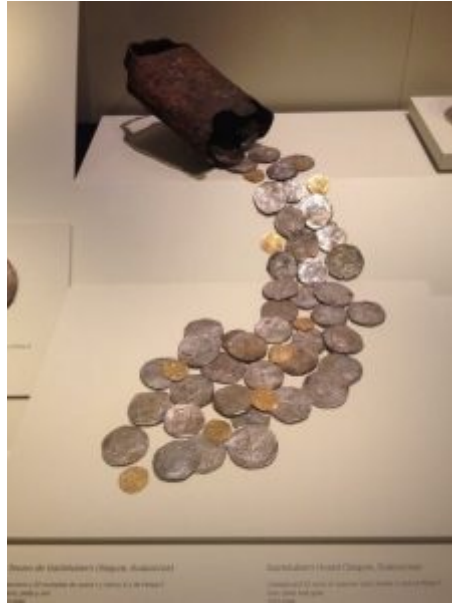
Tesoro de Gazteluberri, en el MAN.

podréis incluso acuñar vuestra propia medalla de recuerdo, a martillo.