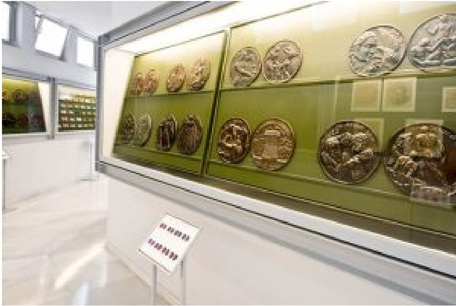
Vitrinas en el Museu Enrique Giner de Nules.