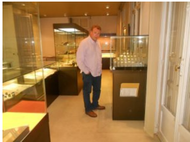
Mi visita al Museu Puig, en 2012

Incluiré en este bloque el Museu Puig de Perpinyà . Aunque se encuentra ya en territorio francés, está a tan solo 90 minutos en coche desde Barcelona, por lo que si os encontráis por la zona vale la pena planteárselo. El museo, formado con la colección del estudioso y coleccionista Joseph Puig durante el siglo XIX, es realmente impresionante.