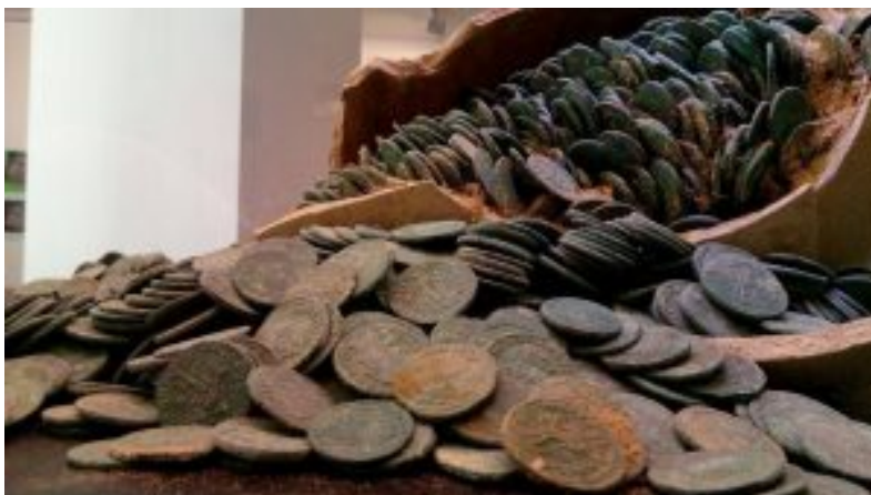
Una de las ánforas del tesoro de Tomares.

El primero de ellos no contaba con una gran exposición numismática, pero ha entrado por la puerta grande al exponer en sus salas parte del famoso tesoro de Tomares, y del que hemos hablado aquí y aquí.