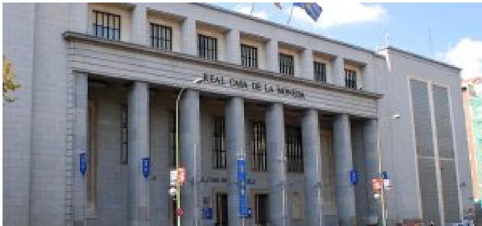
Fachada principal del museo de la Real Casa de la Moneda.

En primer lugar, y como museo más puramente numismático, no puedo poner otro que el museo de la FMMT- Real Museo Casa de la Moneda, en Madrid. En él podréis encontrar un recorrido histórico a través de la moneda, con una grandísima cantidad de piezas, útiles de acuñar, y espectaculares pruebas de acuñación. También encontrareis filatelia y prefilatelia, billetes y otros medios de pago, lotería y juegos, biblioteca histórica, colección artística, maquinaria y útiles para la fabricación empleados por la Fábrica Nacional de Moneda y Timbre-Real Casa de la Moneda. Y para finalizar la visita,