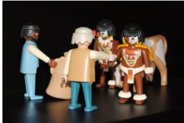
Diorama mostrando el intercambio de productos durante la antigüedad.

Si visitáis Castellón , a pocos kilómetros tenemos el Museo de Medallística Enrique Giner, en Nules. El único en nuestro país dedicado al arte de la medalla, a través de los trabajos de este insigne escultor y medallista del siglo XX. En el encontrareis prácticamente la totalidad de su obra (decenas de medallas), así como bocetos, estudios y pruebas. Muy recomendable.