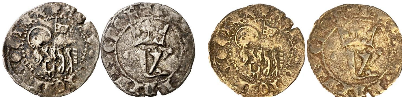
Diferentes imágenes de la misma pieza