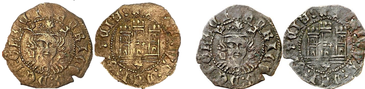
Diferentes imágenes de una misma pieza

E4:15.58: Jerez de los Caballeros -y más improbablemente, Jerez de la Frontera-, Marca "X" gótica. P: 1,48. R: U.