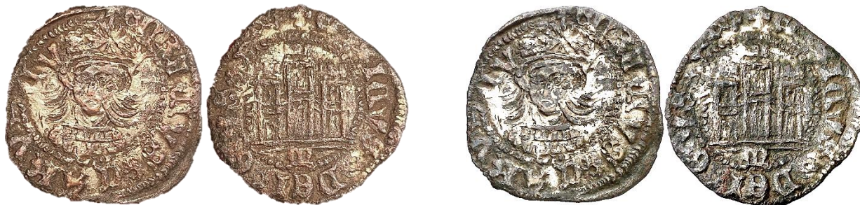
Diferentes imágenes de una misma pieza

E4:15.25: Murcia -u opcionalmente, Medina del Campo-, Marca "M" gótica. P: 1,89. R: 9.