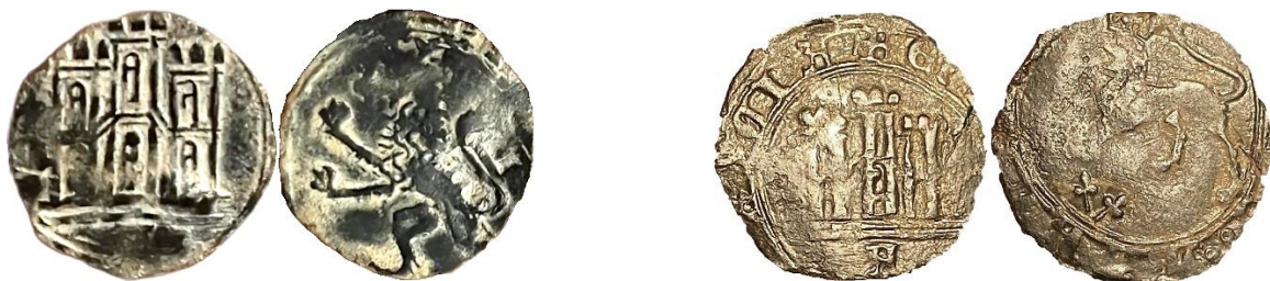
Recorte del E4:20.1. P: 1,12. Pieza recortada de un Maravedí de Ávila con marca "A", con la orla exterior eliminada, quizás para circular como Medio Maravedí.