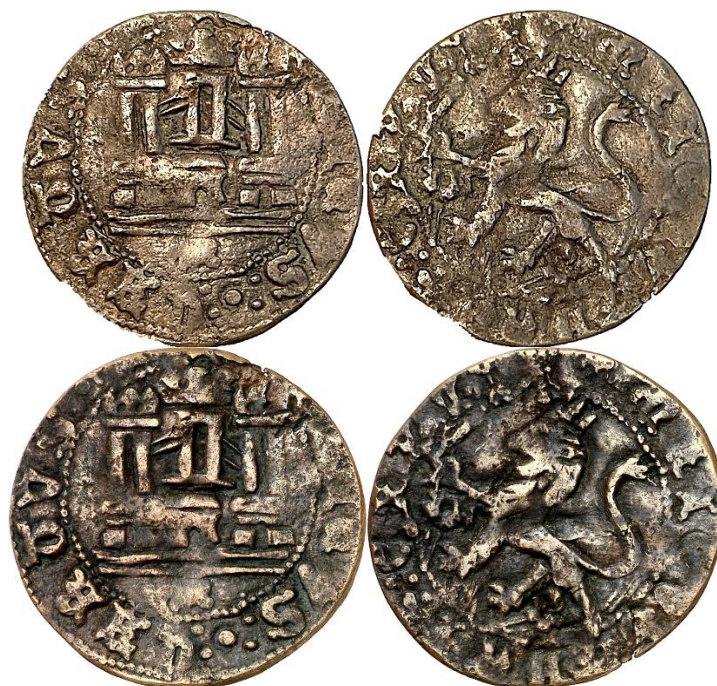
Diferentes imágenes de un mismo ejemplar

E4:20.53: Murcia -y opcionalmente, Medina del Campo-, Marca "M" gótica sin coronar. P: 1,67. R: 7.