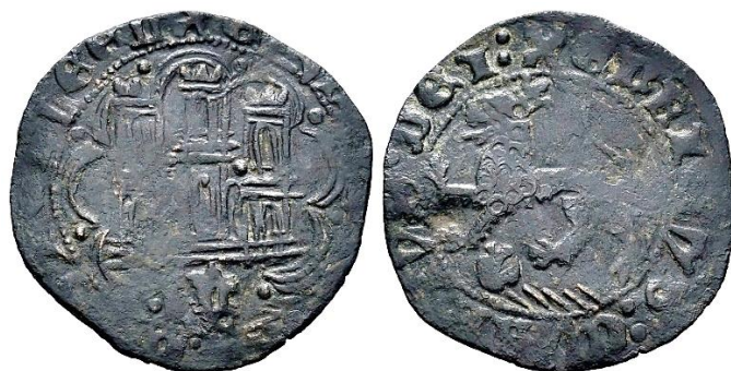
Diferentes imágenes de un mismo ejemplar

E4:20.40: Guadalajara, Marca "G" gótica entre dos puntos. P: 2,28. R: 8. La primera, de Áureo y Calicó, sub. 257/2014; y la segunda, de Tauler y Fau, sub. 48/2019.