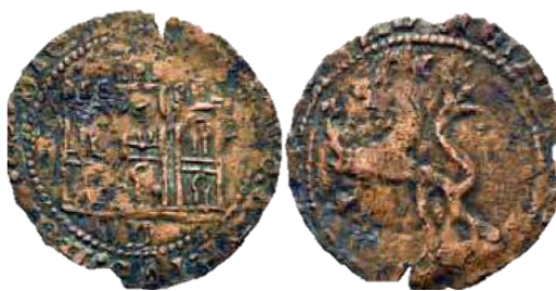
Recorte del E4:20.11. P: 1,01. Pieza recortada de un Maravedí de Córdoba con marca "C" levógira o "D", con la orla exterior eliminada, quizás para circular como Medio Maravedí.