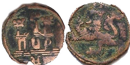
Recorte del E4:20.8. Pieza recortada de un Maravedí de Ávila con marca "A" invertida, con la orla exterior eliminada, quizás para circular como Medio Maravedí.