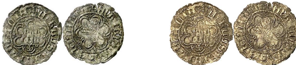
Diferentes imágenes de un mismo ejemplar

E4:22.24: Segovia, Marca Acueducto Invertido en forma de "Y", Vero Invertido, o Flor de Lis Incompleta. P: 0,88. R: U.