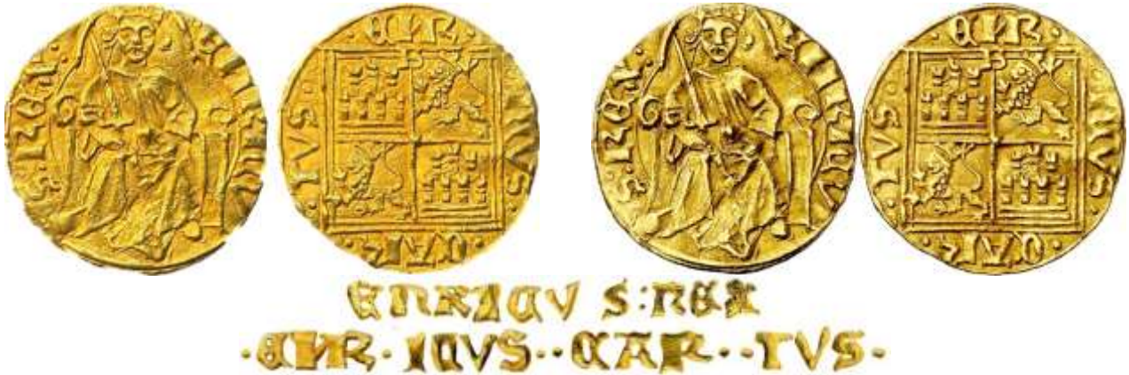
Diferentes imágenes de una misma pieza

E4:4.1: Medio Enrique de la Silla / Medio Enrique de la Silla. Burgos. Marca "B" (ca. 1455 – ca. 1465). P: 2,19. D: 23. R: 10. Jesús Vico Subastas.