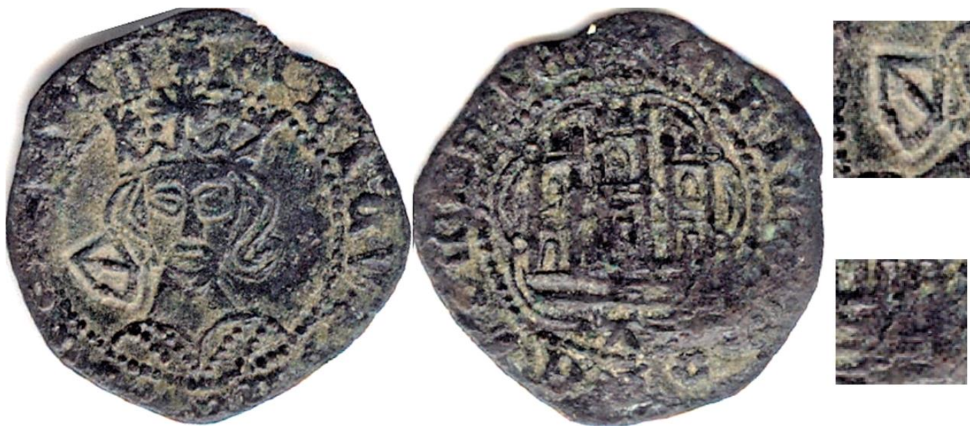
CM:A.1.2: Contramarca de Escudo de la Banda con trazado lineal, realizado en positivo, y con la banda en diagonal de izquierda a derecha, y cartucho en forma también de escudo. El escudo puede tener diferentes tamaños y ser más o menos ancho, o alargado. Estampado en el anverso de un Cuarto de Vellón de Enrique IV, de la ceca de Ávila, del tipo Imperatrix E4:14.21 .