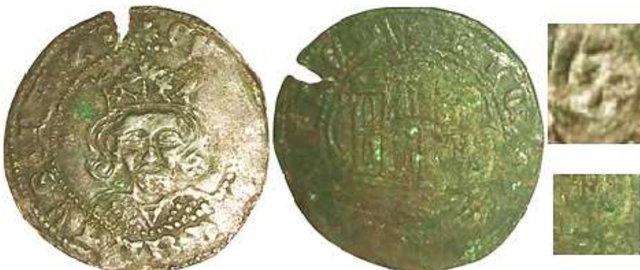
CM:C.S.3: Contramarca de cartucho ovalado de Letra "S" Levógira latina mayúscula en positivo con forma de número "2", y resto del campo en negativo creado por el límite de punzón, colocada encima de la parte derecha del pelo del rey. Estampada en el reverso de un Cuarto de Vellón de Enrique IV, probablemente de la ceca de Ávila, del tipo Imperatrix E4:14.17.