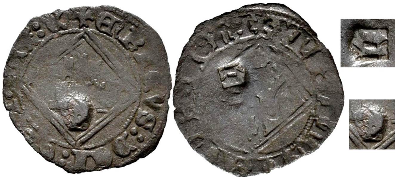
CM:C.E.2: Contramarca de cartucho irregular de aparente Letra “E” gótica minúscula en positivo, con borde cuadrado en negativo en su entorno, localizada a la izquierda del león rampante, machacándole sus zarpas. Estampada en el anverso de una Blanca de Vellón de Enrique IV, del Ordenamiento de Segovia de 1471, probablemente de la ceca de Burgos, del tipo Imperatrix E4:31.17 o E4:31.20 .