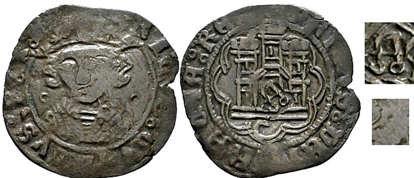
CM:C.A.6: Contramarca de Letra "A" gótica mayúscula, de trazo regular, labrada con dos aros en su base, y que está ubicada en medio de la torre central del castillo. Estampada en el anverso de un Cuarto de Vellón de Enrique IV, de la ceca de Córdoba, del tipo Imperatrix E4:14.63.