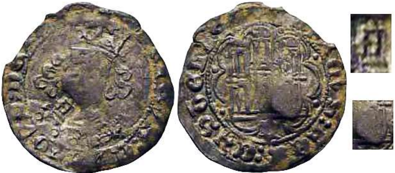
CM:C.A.5: Contramarca de Letra "A" gótica mayúscula, de trazo muy cuadrado y regular - que parece estar grabada sobre una línea de tierra-, localizada junto la mandíbula del rey. Estampada en el anverso de un Cuarto de Vellón de Enrique IV, de la ceca de Guadalajara, del tipo Imperatrix E4:14.86.