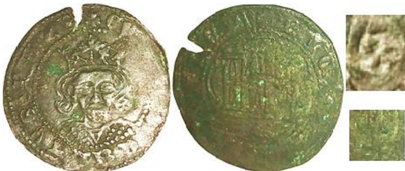
CM:C.S.3: Contramarca de cartucho ovalado de Letra "S" Levógira latina mayúscula en positivo con forma de número "2", y resto del campo en negativo creado por el límite de punzón, colocada encima de la parte derecha del pelo del rey. Estampada en el reverso de un Cuarto de Vellón de Enrique IV, probablemente de la ceca de Ávila, del tipo Imperatrix E4:14.17.