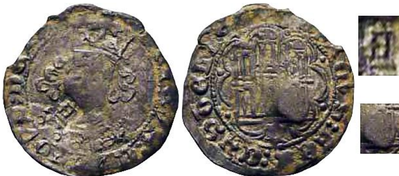
CM:C.A.5: Contramarca de Letra "A" gótica mayúscula, de trazo muy cuadrado y regular - que parece estar grabada sobre una línea de tierra-, localizada junto la mandíbula del rey. Estampada en el anverso de un Cuarto de Vellón de Enrique IV, de la ceca de Guadalajara, del tipo Imperatrix E4:14.86.