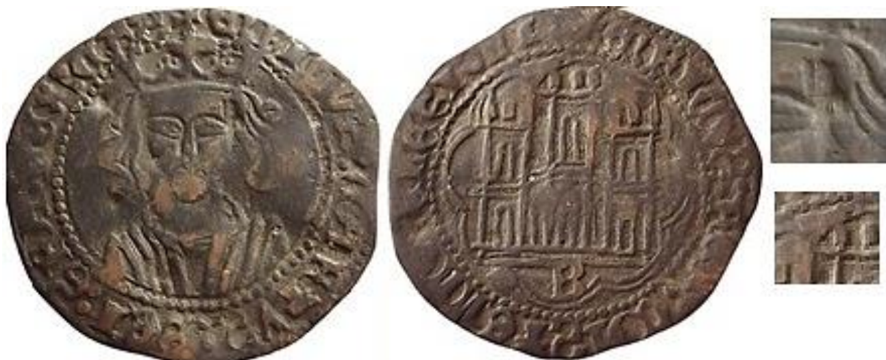
CM:C.I.3: Contramarca de posible Letra "I" latina mayúscula en negativo, cuyo límite es el borde del cartucho, colocada sobre la sien derecha de la frente del monarca Estampada en el anverso de un Cuarto de Vellón de Enrique IV, de la ceca de Burgos, del tipo Imperatrix E4:14.28 .