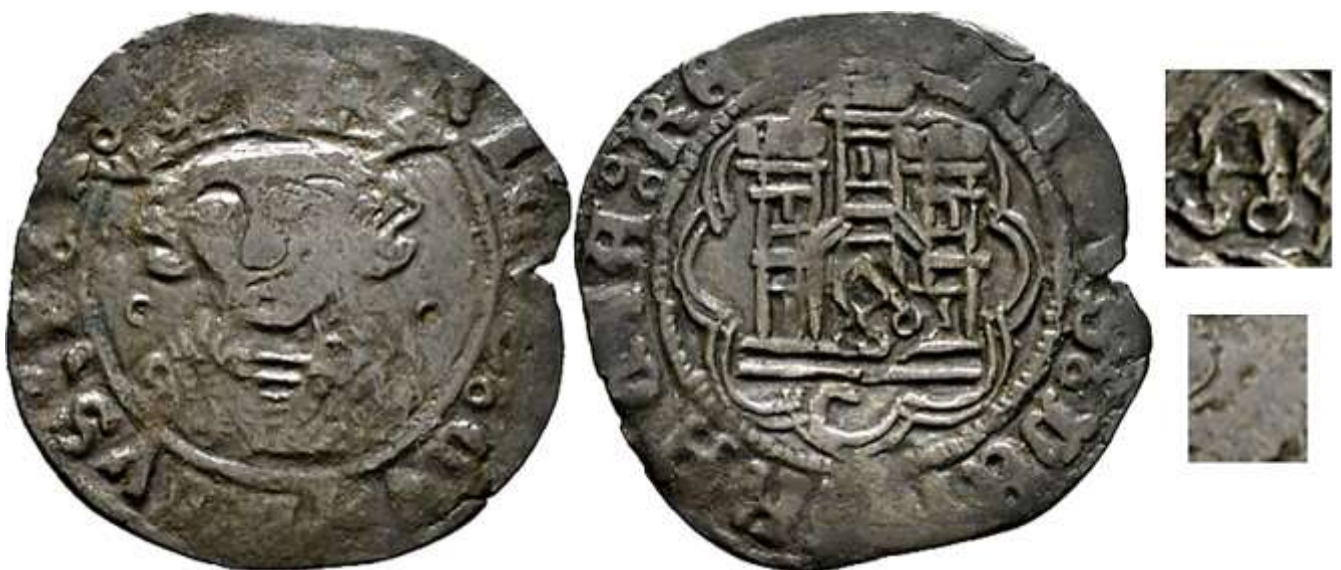
CM:C.A.6: Contramarca de Letra "A" gótica mayúscula, de trazo regular, labrada con dos aros en su base, y que está ubicada en medio de la torre central del castillo. Estampada en el anverso de un Cuarto de Vellón de Enrique IV, de la ceca de Córdoba, del tipo Imperatrix E4:14.63.