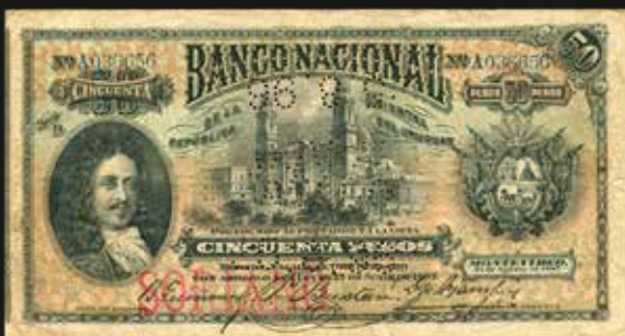
Lote 2100. Uruguay. Banco Nacional de la República Oriental del Uruguay. 50 Pesos 1887, Serie D N°036656. Cancelado con perforación PAGADO 25.8.96. Impreso en Waterlow & Sons. Pick A96b (VF). Est. 700-900