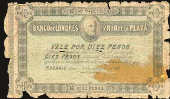
Lote 1864. Argentina. Santa Fe. Banco de Londres y Río de la Plata, Rosario. 10 Pesos Moneda Boliviana 1869. Firmas legibles. Bauman SFE-83a (R7); Pick S1738 (VG) extremadamente escaso Est. 1000-1500