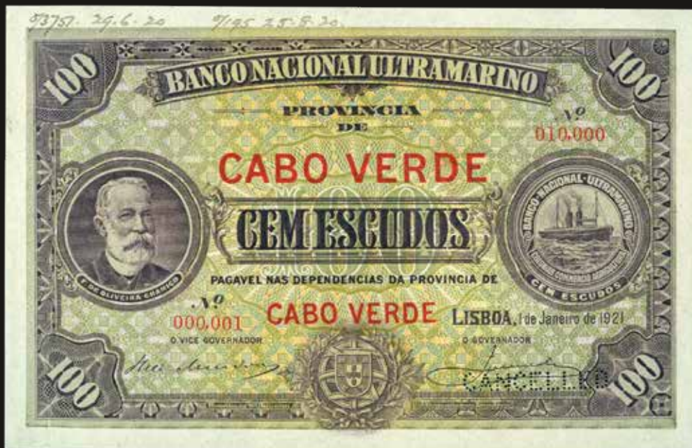
Lote 1614. Cabo Verde. Administración Portuguesa. Banco Nacional Ultramarino. Specimen 100 Escudos 1921. Perforación "CANCELLED". Impreso en BWC. Pick 38s. Certificado WBG 64 UNC Choice. Ejemplar extremadamente raro, tengase en cuenta que la nota tipo figura sin cotizar en Pick. Est. 1500-2000