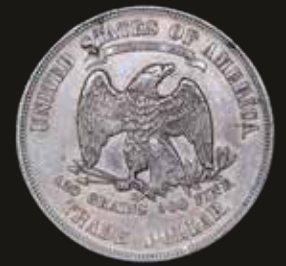
Lote 345. USA. 1 Dollar 1877 S. Trade Dollar. San Francisco mint. Plata 900; 38.1mm; 27.20g. KM108 (XF). Est. 200-300