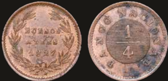
Lote 121. Buenos Aires. 1/4 de Real 1827 Banco Nacional. Casa de Moneda de Buenos Aires. Cobre; 20.0mm; 3.44g. CJ 13; KM2. (XF). Est. 200-300