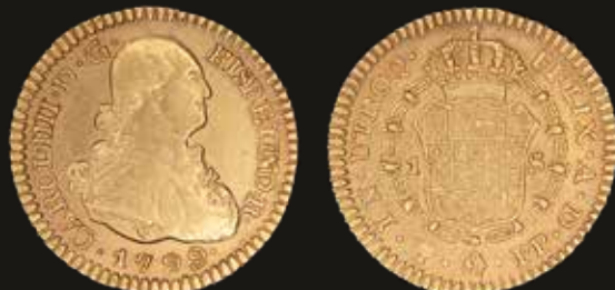
Lote 84. Potosí. Carlos IV (1788-1808) 1 Escudo 1799/8 PP. Variante muy escasa. Solo 884 acuñadas. Oro 875; 18mm; 3.38g. CJ 75.11.1; KM78 (XF) Hairlines. Est. 1500-2000