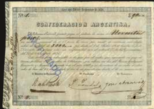
Lote 1800. Argentina. Confederación Argentina. Gobierno Nacional, 90 Pesos 1860, Número 1 / 4, con sello azul AMORTIZADO. 9na emisión: Ley del 29 de Setiembre 1859. Bauman CA-65 (R7); Pick S207. Certificado PMG 30 Very Fine. Est. 3000-4000