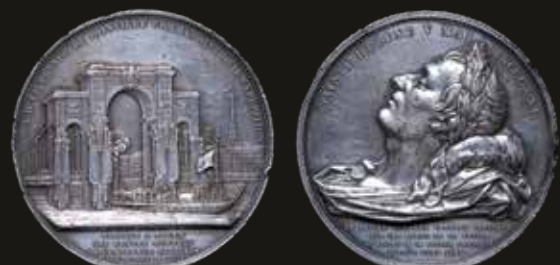
Lote 1431. Francia. 1840. Traslado de los Restos de Napoleón Bonaparte por Ruan. Plata; 63.0mm; 129.89g. Grabador: Depaulis. (XF) en canto "ARGENT". Est. 200-300