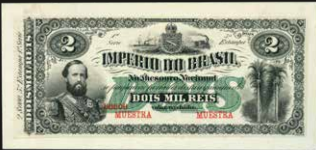
Lote 1599. Brasil. Imperio. No Thesouro Nacional. Front Proof 5000 Reis ND1870. Serie 1°, Quinta Estampa. Impreso en ABNC. Pick A245fp; Amato R021p. WBG 63 UNC Choice. Est. 500-700