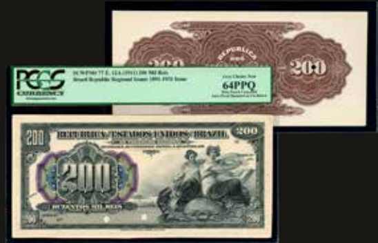
Lote 1601. Brasil. Thesouro Nacional. Front & Back Proof 200 Mil Reis ND1911, Estampa 12a. Pick A77Ef-p. Impresos en ABNC. Certificado PCGS 64PPQ Very Choice New. Est. 750-1000