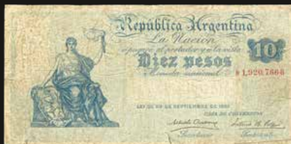
Lote 1909. Argentina. Caja de Conversión. Signos. 10 Pesos 1905, con serie D antes y signo después de la numeración. Firmas: Aubone - Sala. Col 327d; Bot 1471; Pick 237A (F). Est. 900-1200