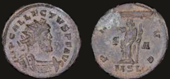
Lote 567. Allectus (293-296AD) Antoninianus. London mint, struck 293AD. Bronze; 23.0mm; 4.43g. A: IMP C ALLECTVS PF AVG. R: PAX AVG, MSL in exergue. RIC V.2 28. (VF). Est. 100-150