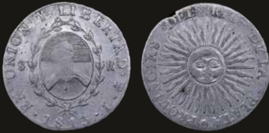
Lote 100. Provincias Unidas del Río de la Plata. 8 Reales 1813 J Variante: Brazo izq caído. Potosí mint. Plata 896; 38.0mm; 26.48g. CJ 4.8 (A22-R47); KM5 (VF). Est. 600-900