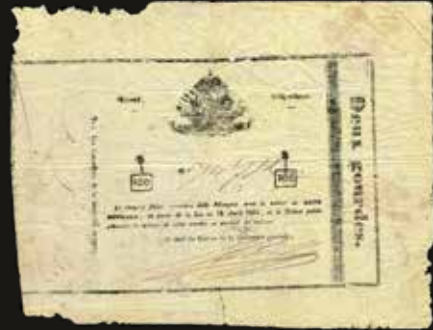
Lote 1674. Haiti. Imperio de Haiti, Emisiones del Tesoro. 2 Gourdes L1851. Firmas manuscritas. Watermark: EMPIRE D' HAYTI. Pick 15a (F). Est. 900-1200