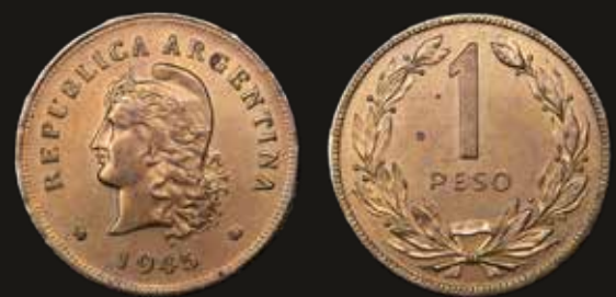
Lote 220. Argentina. Ensayo. 1 Peso 1945. Cuproníquel. Bronce; 28.1mm; 10g. CJ 83.2 (UNC). Est. 400-600