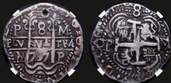
Lote 51. Potosí. Felipe V (1700-1746) 8 Reales 1737 M/E Macuquina redonda. Tipo Galano/Royal. Plata 917; 33.0mm; 26.67g. CJ 43.10.3; KM31. NGC XF Details. Est. 4000-6000