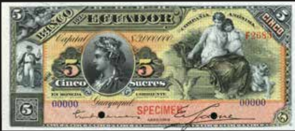
Lote 1660. Ecuador. Banco del Ecuador. Specimen 5 Sucres ND1899-1926, serie F2683, Numeración 00000. Con 2 perforaciones. Impresos en ABNC. Pick S158s. Certificado PMG 53 EPQ About Uncirculated. Est. 800-1200