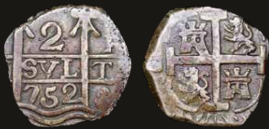
Lote 148. Tucumán. 2 Reales 752. Acuñación oficial-Grupo TN. Figuras ordenadas. R visible en 3er cuadrante. N•T en óvalo visible en 9no cuadrante. 1er y 7mo cuadrantes no visibles. Plata; 22.0mm; 5.03g. CJ 1 (XF) Tono. Est. 400-600