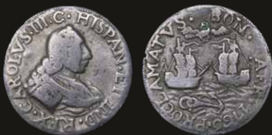
Lote 802. Buenos Aires. Carlos III (1759-1788) Proclama 1760. Plata fundida por plateros. Muy Rara. Plata; 35mm; 11.72g. Cunietti p14; De Angelis n°1; Burzio 8. (F+) Est. 600-900