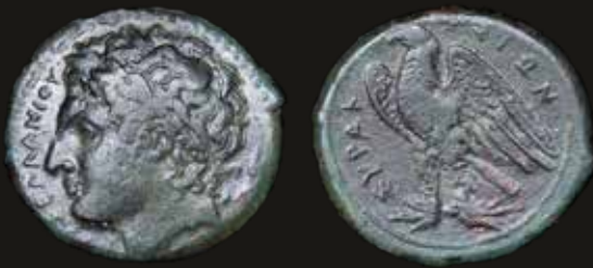
Lote 433. Sicily, Syracuse. Hiketas (287-278BC) Unit. Bronze; 25.0mm; 11.38g. SNG ANS 808; Calciati 157. (XF). Est. 100-150