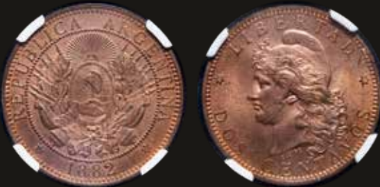
Lote 177. Argentina. 2 Centavos 1882 TOP POP. Ceca de Buenos Aires. Solo 87.502 unidades. Cobre; 30mm; 10.00g. CJ 24.2; KM33. NGC MS64 RB. Est. 1000-1500