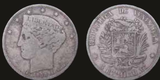
Lote 314. Venezuela. 5 Reales 1858. Paris mint. Plata 900; 30.0mm; 11.13g. Solo 26.120 acuñadas. KMY11 (F+). Est. 400-600