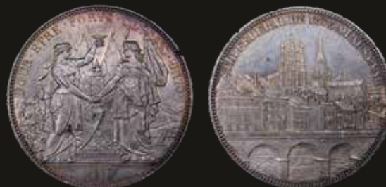
Lote 420. Suiza. Shooting Thaler series. 5 Francs 1876. Lausanne Shooting Festival. Plata 900; 37.0mm; 24.99g. XS13 (AU). Est. 100-150