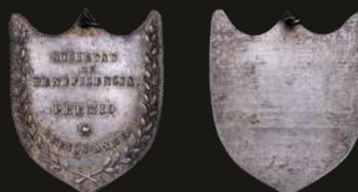
Lote 836. Argentina. ND (1855/6). Premio. Sociedad Beneficencia. Buenos Ayres. Plata; 38.0x32.0mm; 5.51g. Grabador: Cataldi (?) Cunietti 855/01; Rosa 353. (XF). Est. 400-600