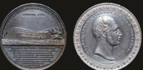
Lote 1452. Gran Bretaña. 1851. Exhibición Mundial Industrial. Prince Albert (1857-1861). Estaño; 51.0mm; 42.56g. BHM2418. (XF). Est. 80-120