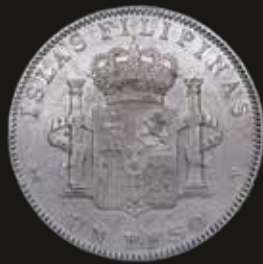
Lote 354. Filipinas. Alfonso XIII (1886-1898) 1 Peso 1897. Plata 900; 37.50mm; 24.83g. KM154 (XF). Est. 100-150