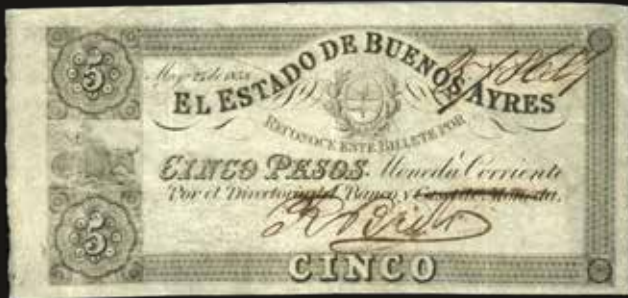
Lote 1799. Argentina. Provincia de Buenos Aires. El Estado de Buenos Aires, Banco y Casa de Moneda. 5 Pesos Moneda Corriente 1858, firma manuscrita. Bauman BA-82; Pick S430a. Certificado PMG 35 Choice Very Fine. Est. 400-500