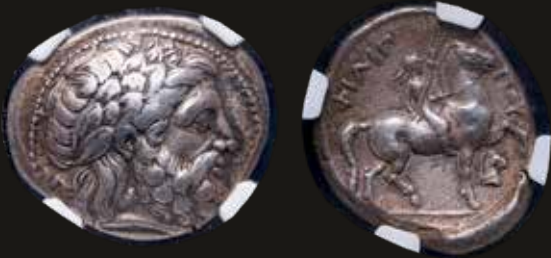
Lote 443. Kings of Macedon. Philip II (359-336BC) Tetradrachm struck 348-342BC. Lifetime issue. Silver; 26.0mm; 14.41g. Le Rider 179. Encapsulated by NGC Ch VF. Est. 600-800