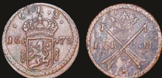
Lote 419. Suecia. Carlos XI (1660-1697) 1 Öre Silvermynt 1673. Cobre; 47.0mm; 50.87g. KM264 (VF). Est. 200-300