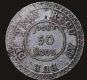
Lote 358. Mauricio. George IV (1820-1830) 50 Sous ND (1822) Ceca de Calcuta. Plata 500; 22.0mm; 6.64g. Emisión de 286.000 ejemplares. KM2 (VF). Est. 300-400