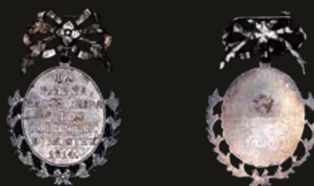
Lote 805. Buenos Aires. 1814. Premio Militar a "Los Libertadores de Montevideo 1814". Plata; 30.0mm; 12.96g. A: LA | PATRIA | RECONOCIDA ! A LOS | LIBERTADs | D MONTEV. | A814. Cunietti p. 54 (XF) . Est. 400-600