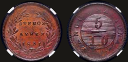
Lote 120. Buenos Aires. 5 Décimos 1831. Casa de Moneda de Buenos Aires. Cobre; 24.0mm. CJ 12; KM3. NGC AU61BN, O'Brien Collection. Est. 200-300