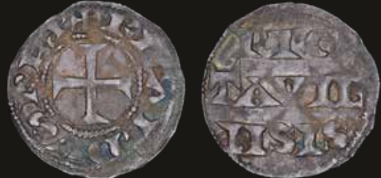
Lote 627. France. Duchy of Aquitaine. R. Lionheart (1169-1199) Denier ND (c.1189-1199). Poitou mint. Silver; 18.5mm; 0.96g. A: + RICARDVS REX. R: PICTAVIENSIS. Elias 8; W SCBC 8008. (XF). Est. 100-150