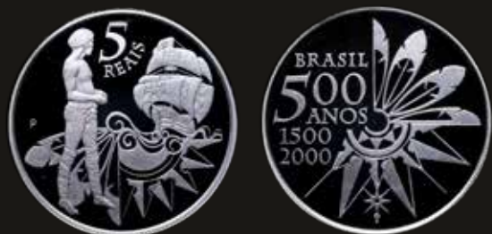
Lote 258. Brasil. Prova / Ensayo. 5 Reais 2000. Plata; 40mm; 27.92g. Bentes CP9.01; (Proof) En estuche de madera. R5 (rareza máxima) sin precio conocido. Est. 600-800