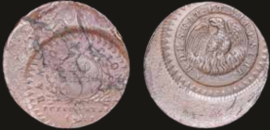
Lote 111. Buenos Aires. 20 Décimos 1827. Descentrada. Casa de Moneda de Buenos Aires. Cobre; 33.0mm; 27.70g. CJ 3.1; KM 5. (AU) Defecto de cospel. Est. 600-800