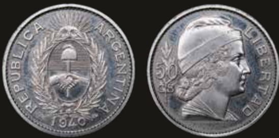
Lote 217. Argentina. Ensayo. 50 Centavos 1940. Libertad de Bazar. Cuproníquel; 24mm; 6.05g. CJ 75.2 (UNC). Est. 400-600