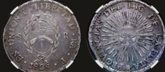
Lote 137. La Rioja. 8 Reales 1828 P (Manuel Piñeyro) Plata 875; 37.0mm. CJ 30; KM20. Certificada por NPG XF45. Est. 600-900