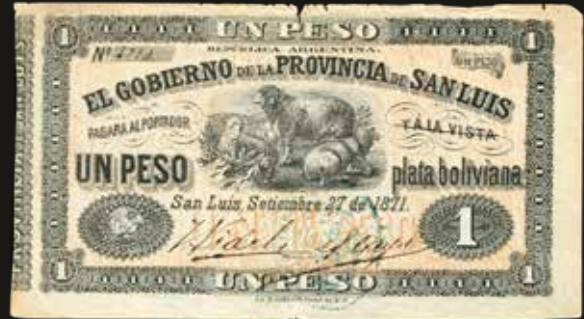
Lote 1856. Argentina. San Luis. El Gobierno de la Provincia de San Luis 1 Peso Plata Boliviana 1871, resello azul. Dos firmas manuscritas. Impreso en Litografía H. Simon, Bs. As. Bauman SLU-Sa (R6) Pick S1395 (VF) Rara. Est. 1000-1500