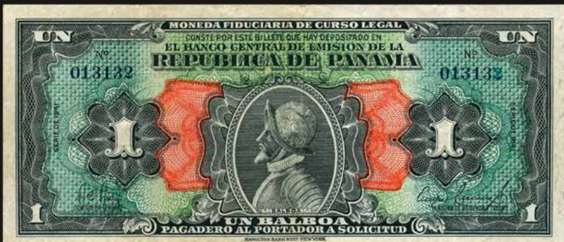
Lote 1695. Panamá. Banco Central de Emisión de la República de Panamá. 1 Balboa 1941, serie N° 013132. Impreso por Hamilton Bank Note Company (USA). Pick 22a (VF). Est. 2000-3000