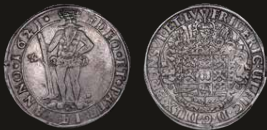
Lote 366. Principado de Brunswick-Wolfenbützel. Frederick Ulrich (1613-1634). 1 Thaler 1621. Zellerfeld mint. Plata; 43mm; 28.0g. KM52.1; Dav 6303 (XF). Est. 500-700