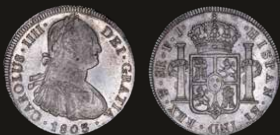
Lote 88. Potosí. Carlos IV (1788-1808) 8 Reales 1803 PJ Plata 896; 41.5mm; 26.90g. CJ 76.15; KM73. (AU). Est. 100-150