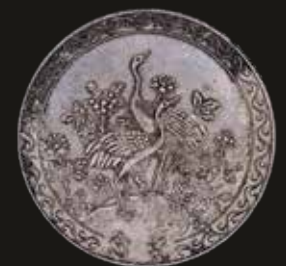
Lote 362. Taiwán. 2000 Yuan 55 (1966) Ensayo. Plata; 33.0mm; 17.52g. (80° años Chiang Kai-shek) KM Pn54 (XF). Est. 100-150