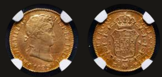
Lote 93. Potosí. Fernando VII (1808-1833) 1 Escudo 1823 PJ Oro 875; 16mm. CJ 85.2; KM92. NGC AU Details - Cleaned. Muy escasa. Est. 2000-3000