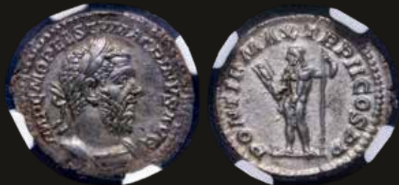
Lote 522. Macrinus (217-218AD) Denarius. Silver; 20.0mm. A: IMP C M OPEL SEV MACRINVS AVG. R: PONTIF MAX TR P II COS P P. RIC IVb 28. NGC graded AU. Est. 400-600