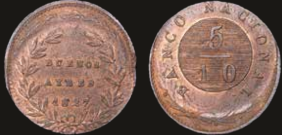
Lote 117. Buenos Aires. 5 Décimos 1827. Descentrada. Casa de Moneda de Buenos Aires. Cobre; 25.0mm; 6.60g. CJ 9.5.4 (A19-R11); KM3 (UNC). Est. 200-300