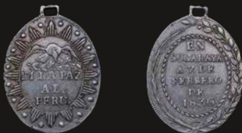
Lote 823. Bolivia. 1836. Di la Paz al Peru en Socabaya. Plata; 30x26mm; 10g. RTB 69 (XF). Est. 600-900