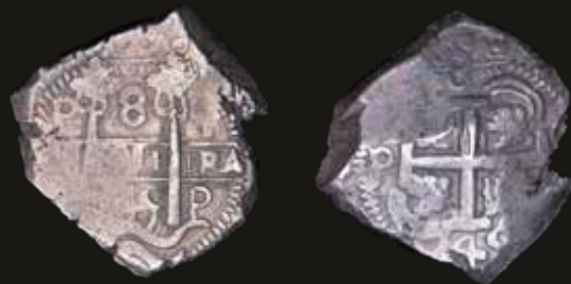
Lote 52. Potosí. Felipe V (1700-1746) 8 Reales 1745/4 q Doble fecha bien visible. triple ceca visible. Plata 930; 33.0mm; 26.78g. CJ 43.18.1; KM40 (XF) 2do ejemplar conocido. Est. 600-900