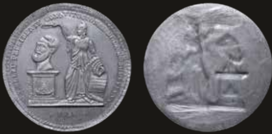
Lote 1182. Bolivia. 1850. Homenaje de los Ministros al Presidente Belzú. Cliché de anverso y reverso. Metal blanco; 73mm; 34.22g y 39.15g. RTB 122 (XF) Est. 400-600