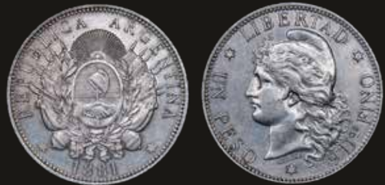
Lote 165. Argentina. 1 Peso 1881 Patacón. Ceca de Buenos Aires. Solo 62.026 piezas acuñadas. Plata 900; 37.5mm; 25.01g. CJ 12; KM29 (AU). Est. 800-1200