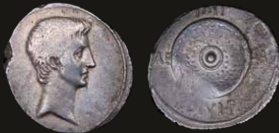
Lote 471. Imperial. Octavian (44-27BC) Denarius. Spanish or northern Italian mint, struck 35-34BC. Silver; 19.0mm; 3.73g. RSC 126; RIC I 543a (XF). Est. 800-1000