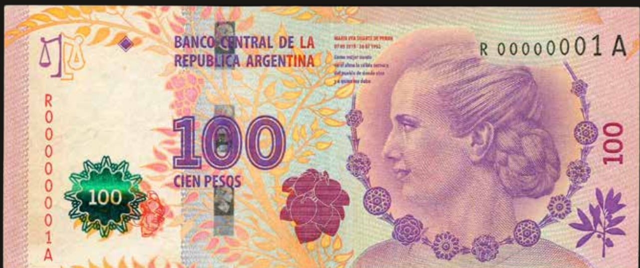
Lote 1991. Argentina. Pesos Convertibles (Tenemos Patria) 100 Pesos 2012 Evita, Reposición número R00000001A. Firmas: Marcó del Pont - Boudou. Col 816r; Bot - ; Pick 358a. (VF+) Increíble reposición número 1 del billete más icónico de la serie de Pesos Convertibles. Est. 1000-1500