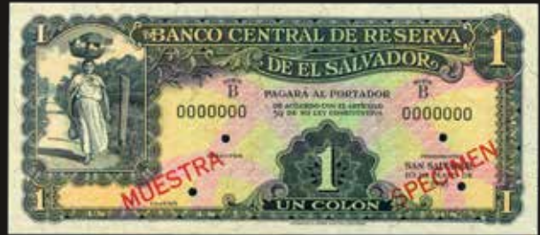
Lote 1663. El Salvador. Banco Central de Reserva de El Salvador. Specimen 1 Colón 1938. Dos resellos en rojo MUESTRA y SPECIMEN Serie B. Numeración 0000000. Sin firmar. Impreso en W&S. Pick 81s. Certificado WBG como 64 UNC Choice. Est. 750-1000