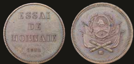
Lote 214. Argentina. Ensayo. 5 Pesos 1932. Un Argentino. Cobre; 22mm; 4.04g. CJ 64.3 (UNC). Est. 400-600