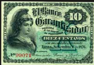
Lote 1736. Perú. El Banco Garantizador. 10 Centavos 1876, serie N°09071. Impreso en NBNC. Pick S161. Certificado PMG 58 Choice About Uncirculated. Est. 1500-2000