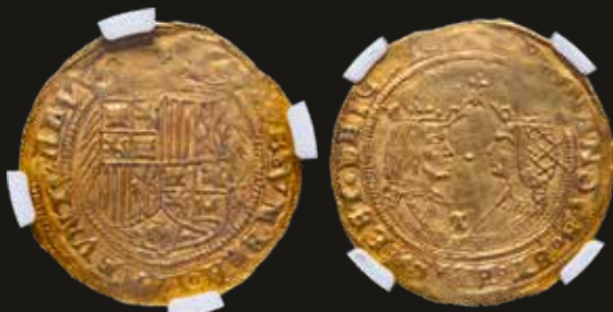
Lote 381. España. Reyes Católicos. Fernando e Isabel (1474-1504) Doble Excelente ND, ceca de Sevilla. Oro; 30.5mm; 6.94g. AC 741; Friedberg 129; Tau 258; ME 2937 var. Est. 3000-4000