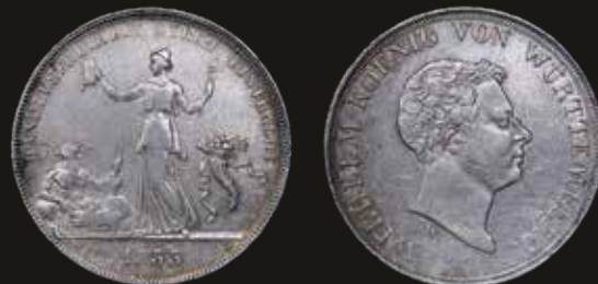
Lote 378. Württemberg. Wilhelm I (1816-1864). Ensayo. 1 Thaler 1833. Plata 868; 38.0mm; 29.36g. Creación de la Unión Aduanera con Prusia, Sajonia, Hesse y Turingia. KR66.2; KM Pn36 (VF). Est. 150-200