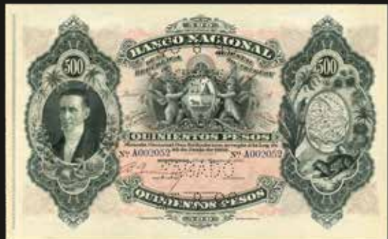
Lote 2101. Uruguay. Banco Nacional de la República Oriental del Uruguay. 500 Pesos 1887, Serie A N°002052. Cancelado con perforación PAGADO 25.8.96. Impreso en Waterlow & Sons. Pick A98b (AU). Est. 1500-2000