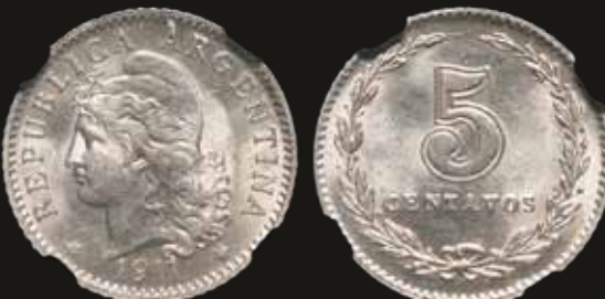
Lote 203. Argentina. 5 Centavos 1911. TOP POP Cuproníquel; 17mm; 2.00g. CJ 142; KM34. NGC MS64. Est. 100-150