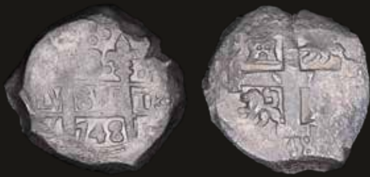
Lote 11. Lima. Fernando VI (1746-1759) 8 Reales 1748 V. Doble Fecha. Muy rara, posiblemente única conocida con dos fechas. Plata 917; 34mm; 26.49g. KM40 (VF). Est. 600-900