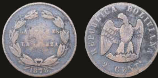
Lote 239. Bolivia. 2 Centavos 1878. Variante rara con leyenda "La Union es la Fuerza" y facial en el anverso. Cobre; 23mm; 4.75g. KM165 (F) Acuñación cruda. Est. 600-900