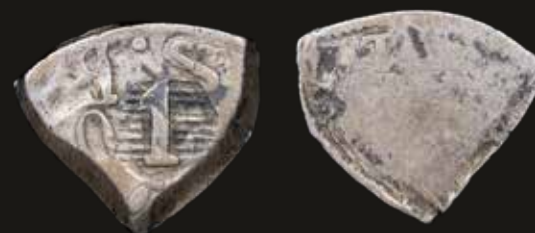
Lote 270. Paraguay. 1 Real SB. Doble resello s/Bolivia 4 Soles 1827-30 Fraccionado. Plata; 18x17mm; 2.59g. Pratt MR1 a3. (VF). Est. 800-1200