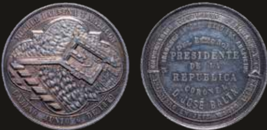
Lote 1326. Perú. 1870. Muelle dársena y malecón del Puerto del Callao. Presidente Balta. Inauguración de las obras. Vista del muelle. Plata; 51.0mm; 70.89g. (AU). Est. 400-600