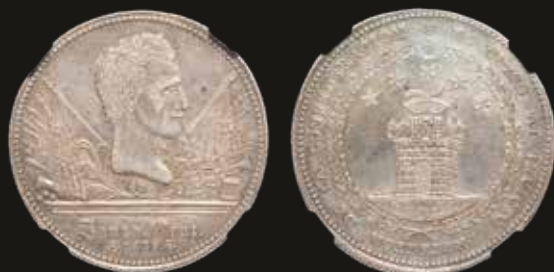
Lote 832. República Sud-Peruana. 1838. Proclama del Gral. Santa Cruz. Ceca de Cuzco. Plata 875; 39mm; 27.10g. Fonrobert 9235; Goepfert-De la Puente, Medallas del Perú p.30. NGC AU58. Est. 1000-1500