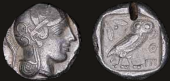
Lote 436. Attica, Athens (440-404BC) Tetradrachm. Silver; 26.0mm; 17.02g. SNG Cop 46; HGC4 1597 (VF) Test cut. Est. 600-800