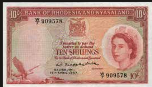
Lote 1752. Rhodesia & Nyasaland. Bank of Rhodesia and Nyasaland. 10 Shillings 1957. Impresos en Bradbury Wilkinson & Co. Pick 20a (XF). Est. 500-700