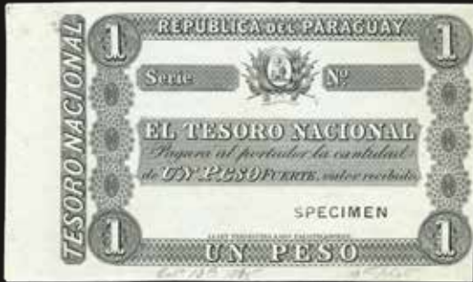
Lote 1698. Paraguay. Tesoro Nacional. Specimen Proof 1 Peso Fuerte ND1864. Impreso en Perkins Bacon & Co. Not in Pick; Pratt MS1. Certificado WBG 61 Uncirculated. Est. 2000-2500