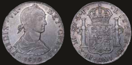
Lote 16. Lima. Fernando VII (1808-1833) 8 Reales 1810 JP. Busto Indígena. Lima mint. Plata 896; 38.0mm; 27.18g. KM106.2. (XF). Est. 350-500