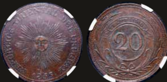
Lote 302. Uruguay. 20 Centésimos 1855. Cobre; 37.3mm. BCU 11; SA 11.1.1; RA 042; KM7. NGC AU53BN. Est. 400-600