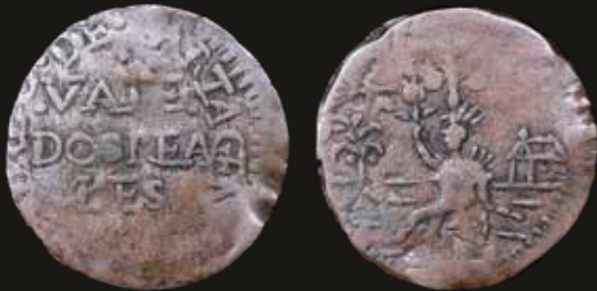
Lote 20. Colombia. Estado de Cartagena. 2 Reales ND (1811) Cobre; 27mm; 3.25g. KMD1 (VF). Est. 200-300