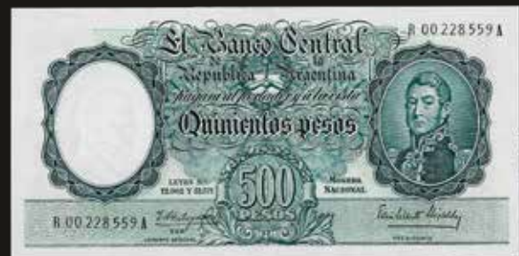
Lote 1944. Argentina. BCRA Moneda Nacional - San Martín joven. 500 Pesos 1963-64 Reposición. Serie A. Números negros. Firmas en negro: Fábregas - Elizalde. Col 518R; Bot 2113; Pick 273c. Certificado PMG 64 EPQ Choice Uncirculated. Est. 600-800