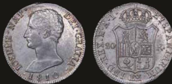
Lote 385. España. José Napoleón (1808-1814) 20 Reales 1810 M AI. Ceca de Madrid. Plata 903; 40mm; 26.88g. Escasa. KM551.2 (XF). Est. 400-600