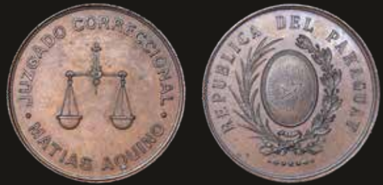
Lote 1285. Paraguay. ND. (1892) Juzgado Correccional. Matias Aquino. Cobre; 37.0mm; 21.52g. República del Paraguay. Peña 37 (AU). Est. 60-90