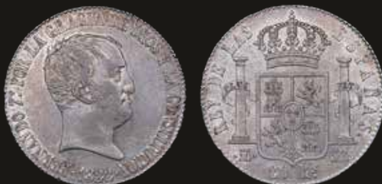
Lote 386. España. Fernando VII (1808-1833) 20 Reales 1822 M SR. Ceca de Madrid. Plata 903; 38.0mm; 26.68g. KM561 (XF) Marquitas. Est. 150-200