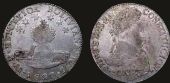
Lote 223. Bolivia. 8 Soles 1827 JM. Simón Bolívar. Plata 903; 38.0mm; 26.98g. Primer año de emisión. Escasa. KM97 (XF) Algunas manchas. Est. 100-150