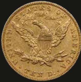
Lote 342. USA. 10 Dollars 1894. Gold Eagle. Coronet Head. Oro 900; 27.0mm; 16.69g. KM102 (XF). Est. 1800-2200