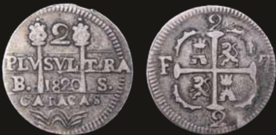
Lote 34. Venezuela. Fernando VII (1808-1833) 2 Reales 1820 BS Caracas. Símil Macuquina. Plata; 24.0mm; 5.62g. KMC6.2. (XF) Golpe en canto. Est. 400-500