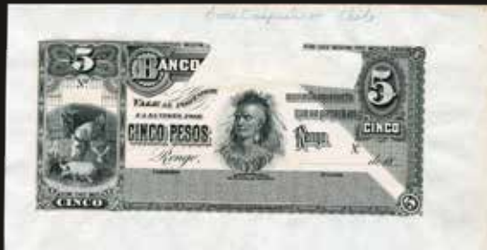
Lote 1621. Chile. Banco de Caupolicán. Front Proof 5 Pesos ND18___. Primera emisión año 1884. Impreso en ABNC. Pick S137 (UNC) montado sobre cartulina. Est. 800-1200