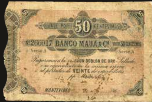
Lote 2085. Uruguay. Banco Maua & Ca, Montevideo. 50 Centésimos 1863, Serie A N°266017. Resello azul AGENCIA BANCO MAUA & Ca * MERCEDES*. Impreso en BWC. Pick S262 tipo (VF). Muy raro, agencia no listada en Pick Est. 600-900