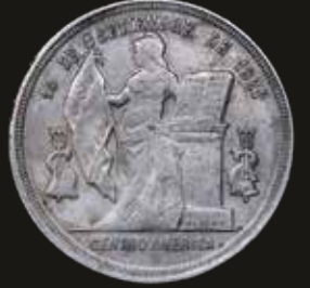
Lote 333. Honduras. 1 Peso 1889/8. Tegucigalpa mint. Plata 900; 37mm; 25.07g. KM56 (VF). Est. 200-300