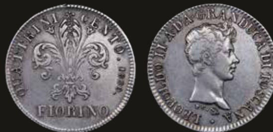
Lote 402. Italia. Toscana. Leopold II (1824-1859) 1 Fiorino 1830. Plata 916; 24.0mm; 6.77g. MIR 452 (XF). Est. 200-300