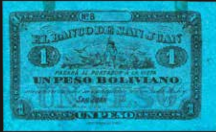
Lote 1851. Argentina. San Juan. El Banco de San Juan. 1 Peso Boliviano 187_. Litografía G. Kraft. Bauman SJU-15 (R6) Bauman plate, el mismo Not in Pick. (VF+). Est. 900-1200