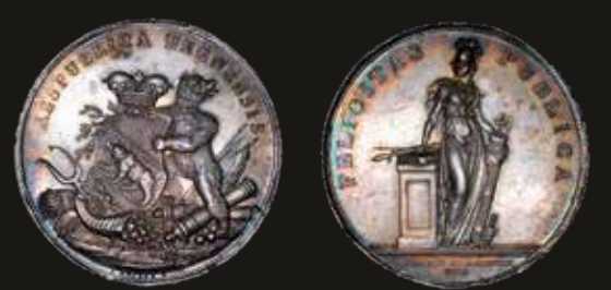
Lote 1495. Suiza. Berna. Sechzehnerpfennig. ND (pos 1780) Plata; 57mm; 92.41g. A: REPUBLICA BERNENSIS. Haller 791; SM 633; Wunderly 1360.(XF). Est. 400-500