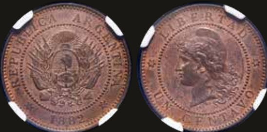
Lote 182. Argentina. 1 Centavo 1882. Ceca de Buenos Aires. La fecha mas escasa, solo 108.202 unidades. Cobre; 25mm; 5.00g. CJ 38.1; KM32. NGC MS62 BN. Est. 1000-1500