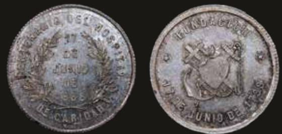
Lote 1339. Uruguay. 1888. Centenario. Hospital de Caridad. Acuñada sobre Argentina, 50 Centavos "Medio Patacón" 1882. Pieza para estudiar. Plata 900; 30.0mm; 11.40g. Vera 74. (XF). Est. 200-300