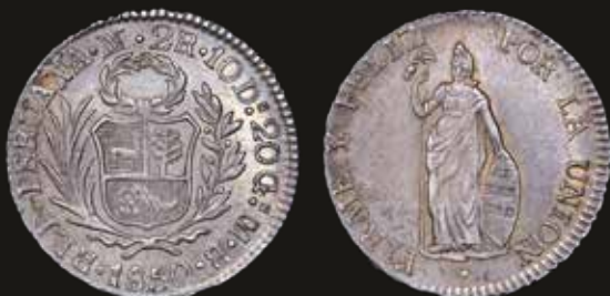
Lote 293. Perú. 2 Reales 1850 MB. Lima Mint. Plata 896; 27.0mm; 6.37g. Variante con gorro largo con coleta. KM141.3 Hernández Collection, O'Brien Collection. (AU). Est. 300-400