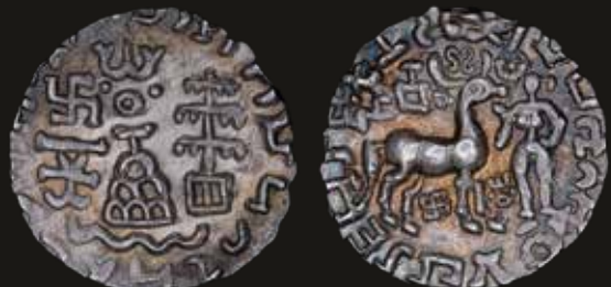
Lote 678. Kuninda Kingdom. Amoghabhuti (c.200-100BC) Drachm. Silver; 18.0mm; 2.22g. ACR 1140. (XF). Est. 400-600