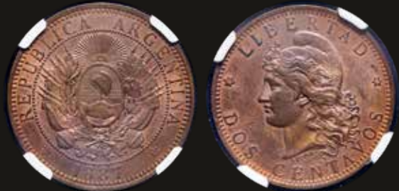
Lote 179. Argentina. 2 Centavos 1887 TOP POP. Ceca de Buenos Aires. Solo 363.200 unidades. Cobre; 30mm; 10.00g. CJ 28.2; KM33. NGC MS63 BN. Est. 1000-1500