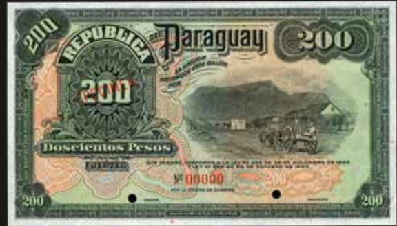
Lote 1708. Paraguay. Oficina de Cambio. Specimen 200 Pesos Fuertes 1920-23 serie N°00000. Sin firmas. Impreso en ABNC. Pick 153s; Pratt MS 104 (UNC). Est. 500-700