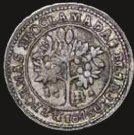
Lote 317. Costa Rica. 1 Real 1847 CR JB. "B" Normal. Ceca de San José. Plata 903; 20.0mm; 2.92g. Rara. KM65 (AU). Est. 700-1900