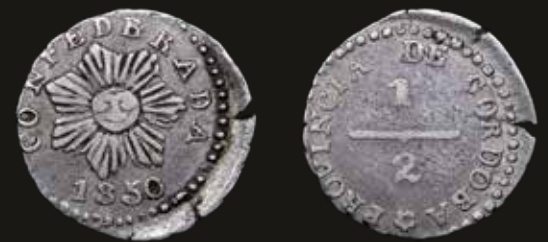
Lote 135. Córdoba. 1/2 de Real 1850. Plata 750; 15mm; 1.16g. Sol de siete puntas, error "CONFEDRRADA". CJ 60.3.1 (A1-R3); KM29 (XF) Descentrada. Est. 100-150