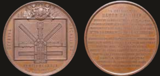
Lote 1321. Perú. 1862. Penitenciaría de Lima. Decreto 20 Octubre 1855 Piedra Fundamental: 31 Enero 1856. Inauguración: 23 Julio 1862. Plano. Cobre; 68.5mm; 128.95g. Grabador: Oudine. (XF). Est. 80-120