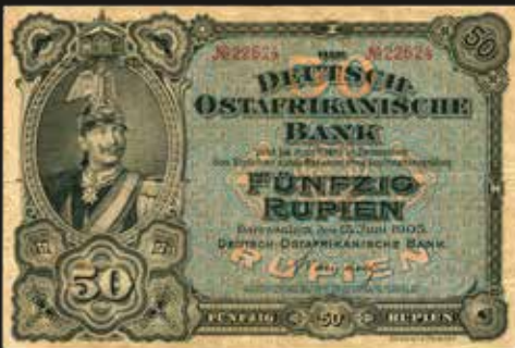
Lote 1670. German East Africa. Die Deutsche Ostafrikanische Bank 50 Rupien 1905. Impresos en Giesecke & Devrient. Pick 3b (VF). Est. 700-900