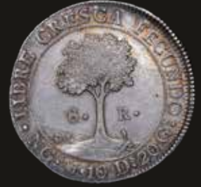
Lote 318. República de Centro América (Guatemala) 8 Reales 1835 NG M Plata 903; 40.0mm; 26.85g. KM4 (AU) Hermosa pátina. Est. 600-900