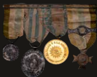
Lote 845. Guerra Triple Alianza. Conjunto de cuatro medallas unificadas en un broche. Muy raro de ver una tira completa perteneciente a un mismo combatiente. (XF) Est. 4000-6000