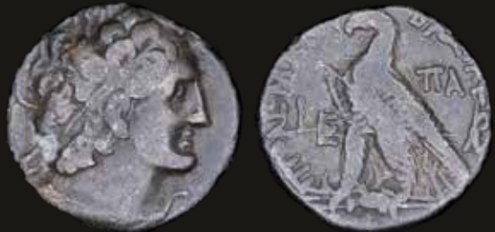
Lote 462. Ptolemaic Kingdom. Ptolemy XII Neos Dionysos (Auletes) (80-58BC) Tetradrachm. Alexandria mint, RY 5 = 77/6BC. Silver; 25.0mm; 13.25g. Svoronos 1851; DCA 69. (VF). Est. 400-600