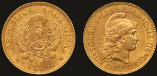
Lote 162. Argentina. 5 Pesos 1889 "Argentino de oro". Ceca de Buenos Aires. Oro 900; 22.0mm; 8.06g. Solo 403.712 emitidas. CJ 9; KM31 (AU). Est. 1200-1400