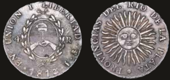
Lote 103. Provincias Unidas del Río de la Plata. 4 Reales 1813 J Plata 896; 33.0mm; 13.44g. CJ 7.1.2 (A2-R2); KM5 (XF). Est. 600-900