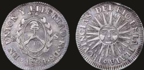
Lote 143. La Rioja. 2 Soles 1824 RA. Plata 875; 26.0mm, 6.52g. CJ 41.3 (A3-R1); KM18 (XF). Est. 300-400