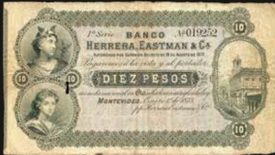
Lote 2082. Uruguay. Banco Herrera Eastman & Ca, Montevideo. 10 Pesos 1873 remainder, Serie 1° N°019252. Impreso en BWC. Pick S181r (F+) algunas roturas que no afectan el diseño. Extremadamente raro. Est. 1000-1500