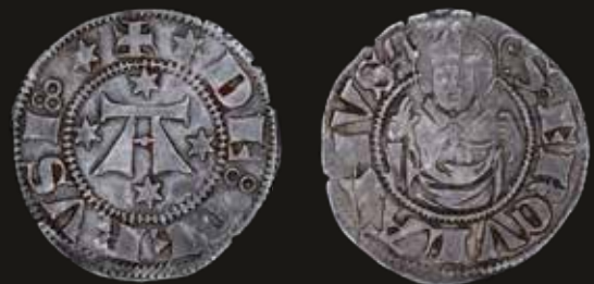
Lote 658. Italian States. Perugia. Bolognino, struck 1374-1376AD. Billon; 18.0mm; 1.01g. A: .S .ERCVLANVS. R: + DE PERVSI. Biaggi 1864. (XF). Est. 60-90