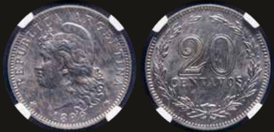
Lote 192. Argentina. 20 Centavos 1899 TOP POP en NGC. Ceca de Buenos Aires. Cuproníquel; 21.5mm; 4.00g. CJ 55.1; KM36. NGC MS64 (2 piezas). Est. 1000-1500