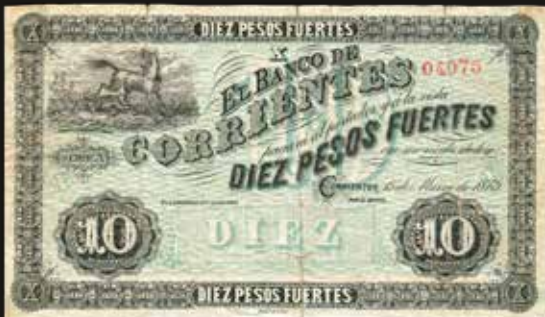
Lote 1823. Argentina. Corrientes. El Banco de Corrientes. 10 Pesos Fuertes 1873 remainder, Serie A, 04075. Impreso en Litografía Kraft. Bauman CRR-76r (R5); Pick S1617. (VF). Est. 500-700