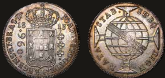
Lote 246. Brasil. Joao VI Principe Regente (1799-1816) 960 Reis 1813 B, sobre 8 Reales. Ceca de Bahia. Plata 896; 40.0mm; 26.56g. KM307 (AU). Est. 150-200