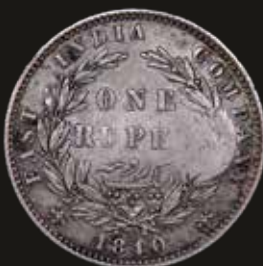
Lote 359. Mozambique Portugués. Luis I (1861-1889) y Carlos I (1889-1908). 450 Reis ND (1889). Contramarca «PM coronada» s/ Compañía de Indias Orientales. Rupee 1840. Plata; 31.0mm; 11.54g. KM40.2 (VF). Est. 100-150