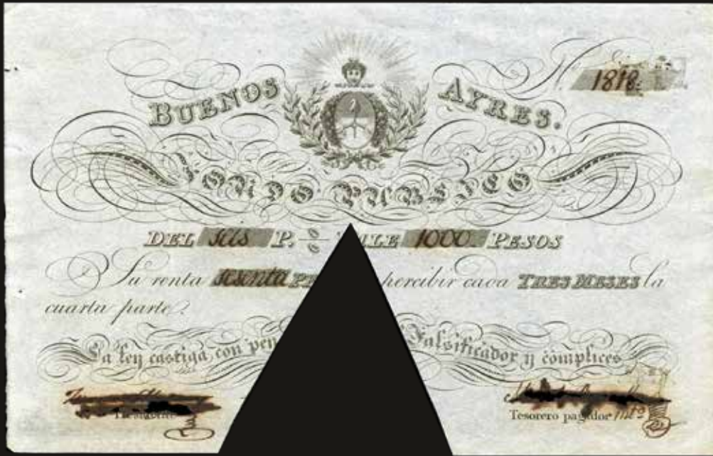
Lote 1793. Argentina. Fondo Público (Buenos Aires) 1000 Pesos ND1816-1820 Cancelado. Primera serie, impresos en Londres. Bauman VA-1b (R6); Not in Pick (XF) Est. 800-1000