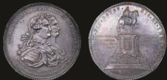
Lote 819. México. Carlos IV (1788-1808) 1796. Carlos y Luisa. Inauguración del monumento al Rey en México. Plata; 32mm; 15.54g. Grove C268 (AU) Est. 200-300