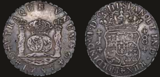
Lote 22. Guatemala. Fernando VI (1747-1760) 8 Reales 1757 J. Columnaria. Plata 917; 39mm; 26.86g. KM18 (XF). Est. 1000-1500