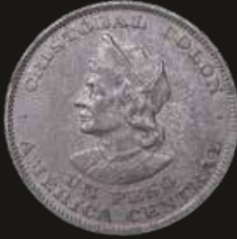
Lote 320. El Salvador. 1 Peso 1911. Monnaie Royale de Belgique. Plata 900; 37.0mm; 25.00g. KM115.1 (XF). Est. 200-300