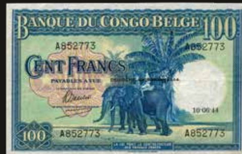
Lote 1653. Congo Belga. Banque du Congo Belge. 100 Francs 1944 serie A 852773. Firmas: Goeman - Baseleer. Impreso en Waterlow & Sons Limited. Pick 17a (XF). Est. 600-800