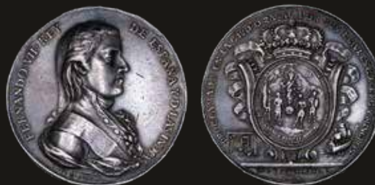
Lote 821. México. Fernando VII (1808-1833) Medalla de Proclamación. Zacatecas. Plata; 42.0mm; 36.12g. Grove-F-199a. (XF) Est. 400-600