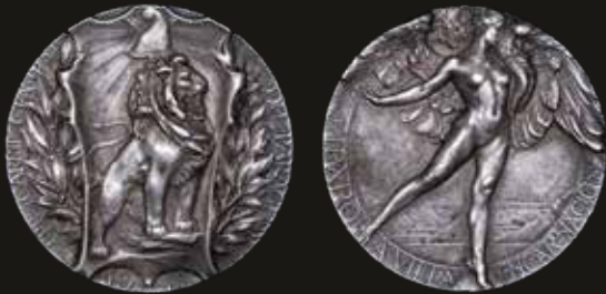
Lote 1299. Paraguay. Ferroviarias. 1911. Ferrocarril de Pirapó a Villa Encarnación. Plata; 33mm; 20.70g, (XF) Marcada "ARGENT" en canto. Est. 600-900