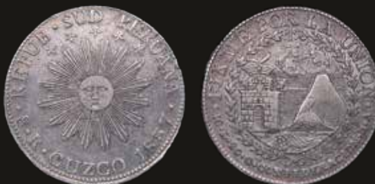
Lote 298. Perú. 8 Reales 1837 MS. Repub. Sud Peruana. Cuzco mint. Plata 903; 39mm; 26.91g. La 2da mas escasa de la serie KM170.4 (XF). Est. 600-900