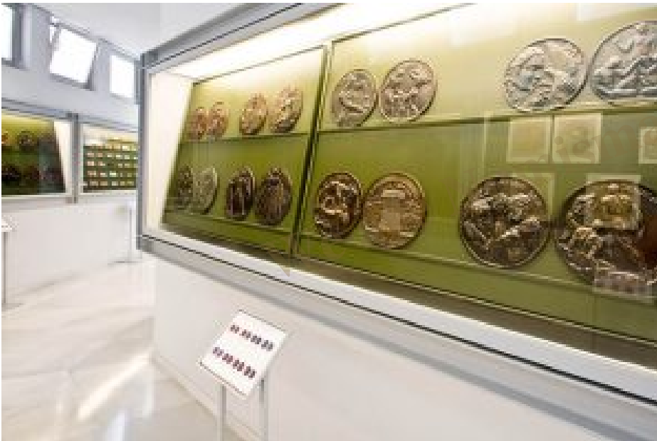
Vitrinas en el Museu Enrique Giner de Nules.

Si visitáis Castellón , a pocos kilómetros tenemos el Museo de Medallística Enrique Giner , en Nules. El único en nuestro país dedicado al arte de la medalla, a través de los trabajos de este insigne escultor y medallista del siglo XX. En el encontrareis prácticamente la totalidad de su obra (decenas de medallas), así como bocetos, estudios y pruebas. Muy recomendable.