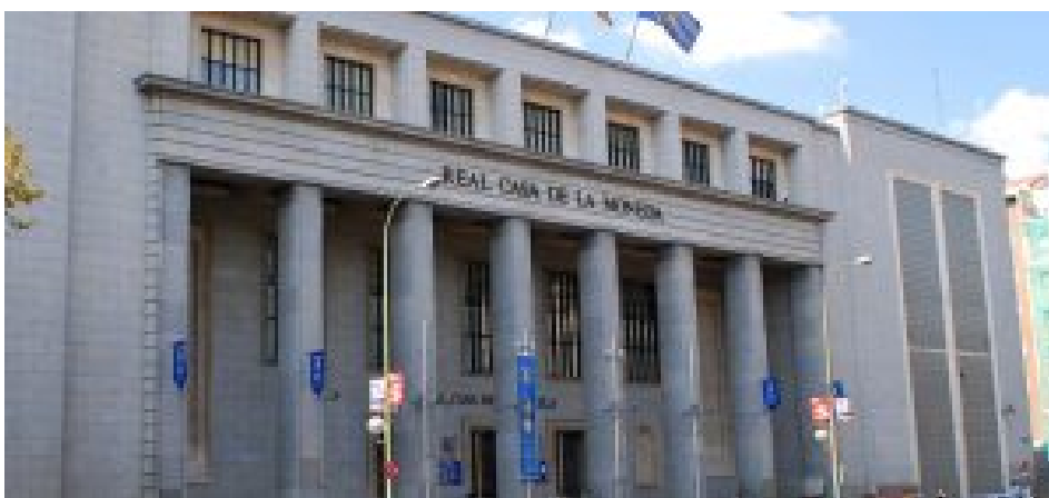
Fachada principal del museo de la Real Casa de la Moneda.

En primer lugar, y como museo más puramente numismático, no puedo poner otro que el museo de la FMMT- Real Museo Casa de la Moneda