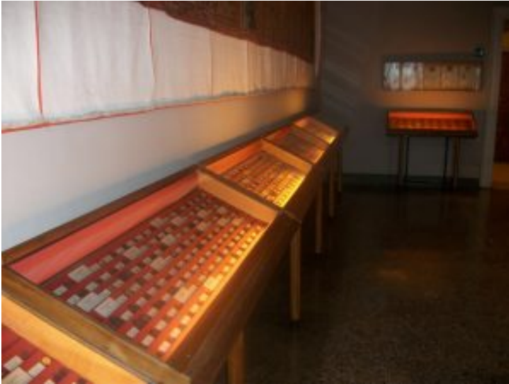
Museo Correr, Venecia.