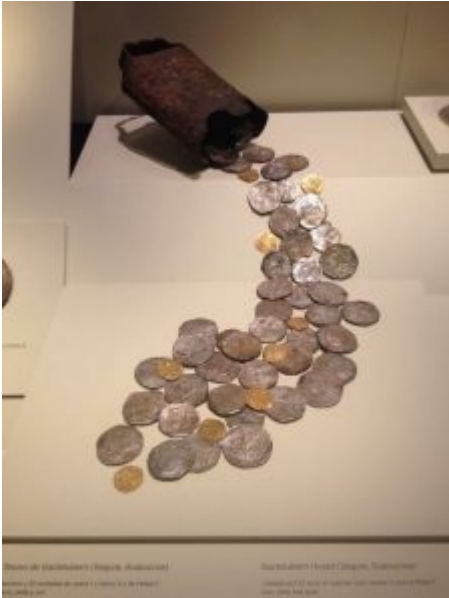
Tesoro de Gazteluberri, en el MAN.

, en Madrid. En él podréis encontrar un recorrido histórico a través de la moneda, con una grandísima cantidad de piezas, útiles de acuñar, y espectaculares pruebas de acuñación. También encontrareis filatelia y prefilatelia, billetes y otros medios de pago, lotería y juegos, biblioteca histórica, colección artística, maquinaria y útiles para la fabricación empleados por la Fábrica Nacional de Moneda y Timbre-Real Casa de la Moneda. Y para finalizar la visita, podréis incluso acuñar vuestra propia medalla de recuerdo, a martillo.